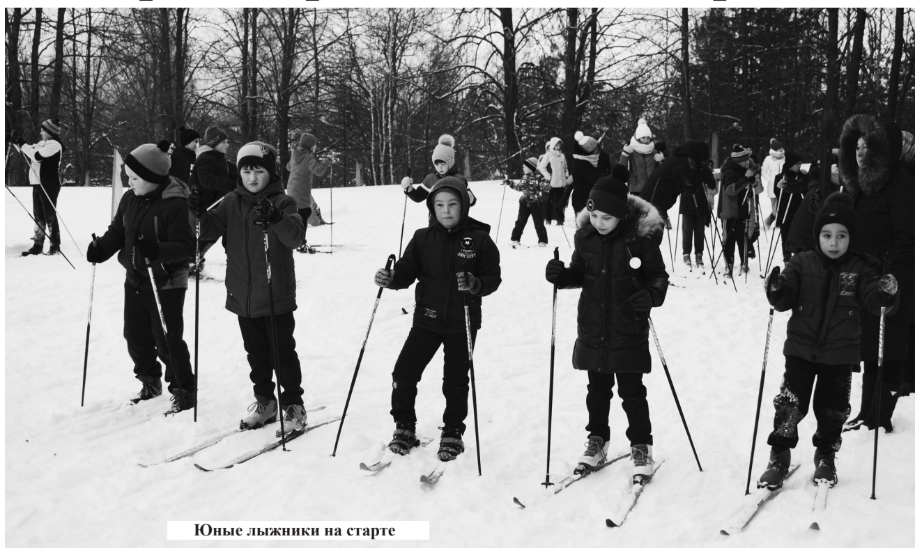
Юные лыжники на старте